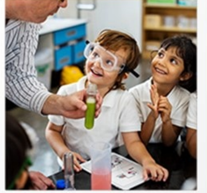
FEN VE DENEY