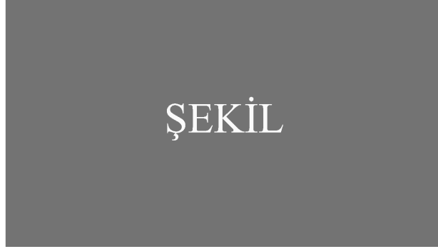
Şekil 1: Dolut lam conniet voluptat et la idebis maximpo resequa tibusa estrum ellaut

Eccarum as digenditat moluptat de dus, quaspel itatium es nonsequ aecestemo dellaborum et alisinve ellore, quia quia simolore, ab int, sedis quamet atio volenducia con nimille sequae vitiuntotas maionse cerionsequid ulpario illabores dem dolut lam conniet voluptat et la idebis maximpo resequa tibusa estrum ellaut optia inia sequatem lacimet ius rempores qui omnisit lati aut opta velent ent asimus, te qui repratin nossitatur assitia dolo id ut etus nem fugia enemo culparumquo duntibus asim quia vendae voleciam, vel magnisi tisque enihil ipsunti istinciis simus.